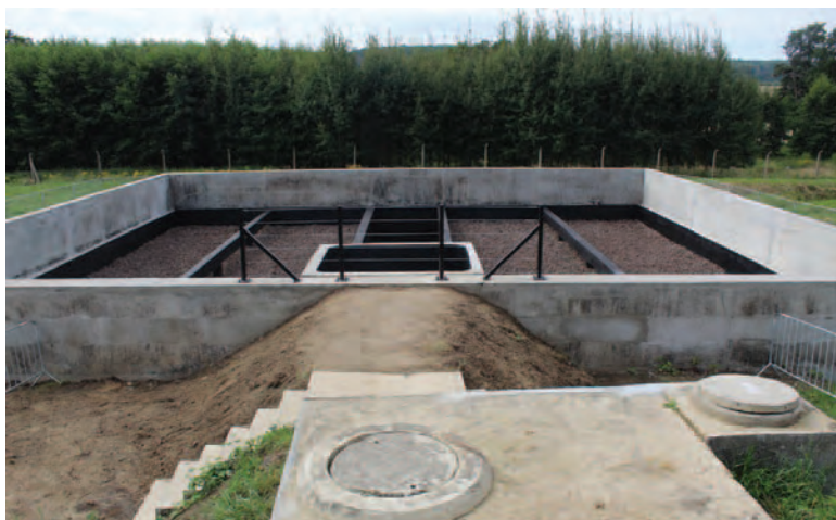
Obozowa oczyszczalnia ścieków – stan po remoncie