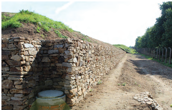
Mur oporowy przy baraku „Wetterstelle” – stan po remoncie