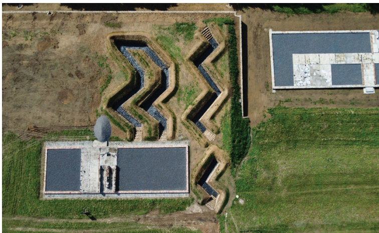
Rowy przeciwlotnicze przy baraku Wetterstelle – stan po remoncie