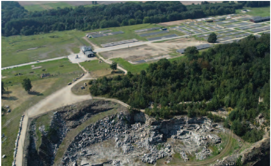
Teren Muzeum Gross-Rosen w Rogoźnicy – zdjęcia wykonane z drona