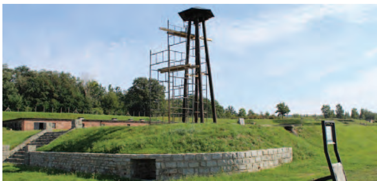
Mur oporowy w zachodnim narożniku placu apelowego – stan po remoncie