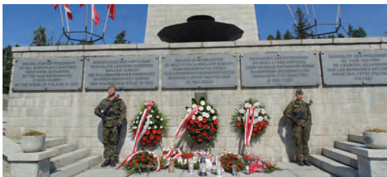
Uroczystość w rocznicę wybuchu II wojny światowej – Muzeum Gross-Rosen w Rogoźnicy, 5.09.2021 r.