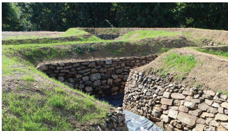
Rowy przeciwlotnicze pomiędzy barakiem 11 a rewirem V – stan po remoncie