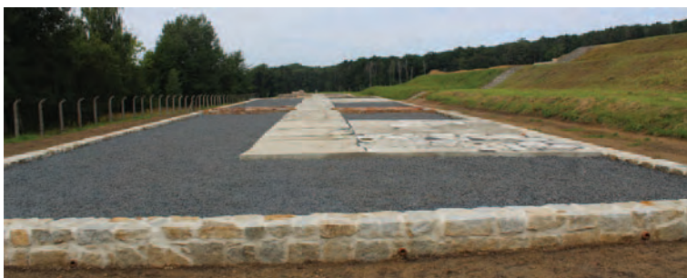
Budynek rewiru VI – stan po rekonstrukcji obrysu i remoncie