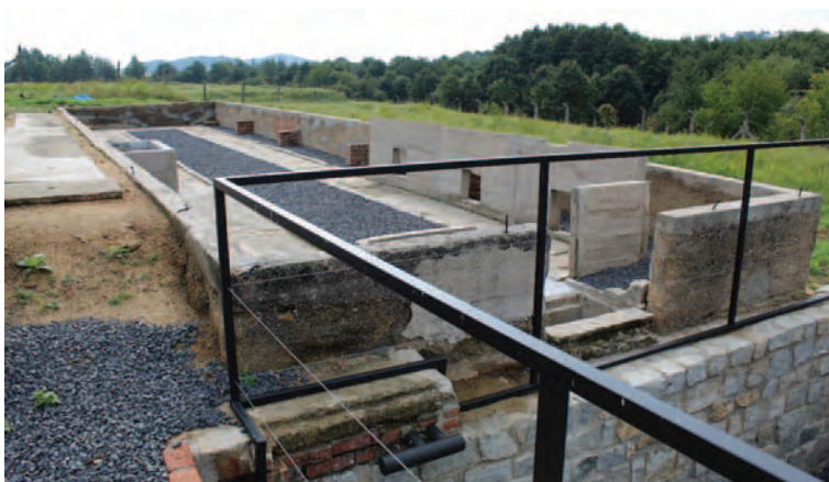
Szklarnia SS w części więźniarskiej obozu – stan po remoncie